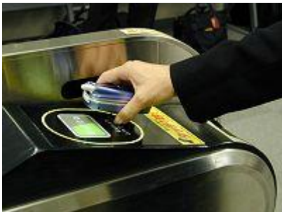
Figuur 16 Mobiele Suica