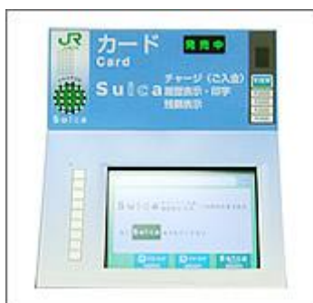
Figuur 9 Suica vending machines

Een Suica kaart is op het station te koop, bij loket of speciale machines (Figuur 9), voor 2000 yen (15 Euro). Hiervan is 500 yen onderpand dat terugbetaald wordt bij inlevering van de kaart. De overige 1500 yen is voor treinreizen. Opwaarderen van de kaart kan bij speciale machines op het station. Deze machines geven ook het restbedrag aan van de kaart en kunnen een overzicht van de verreden treinreizen uitprinten. Het is niet mogelijk om het tegoed over te schrijven naar een andere Suica kaart. De Suica kaart is alleen beschikbaar voor volwassenen, er bestaat geen aangepast tarief voor kinderen, zoals dat wel het geval is voor normale kaartjes.