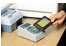
Figuur 10 Betalen aan de kassa met Suica

Winkels die aangesloten zijn op het systeem accepteren betaling met de SUICA kaart (Figuur 10). Daaronder valt ook de verkoop van drank en eten in de trein zelf. Verkooppunten waar met de Suica kaart betaald kan worden, zijn gekenmerkt met een teken (Figuur 11). Op dit moment zijn meer dan 900 stationswinkels en bijna 700 andere winkels in Tokio aangesloten op het systeem. Dit aantal stijgt nog steeds.