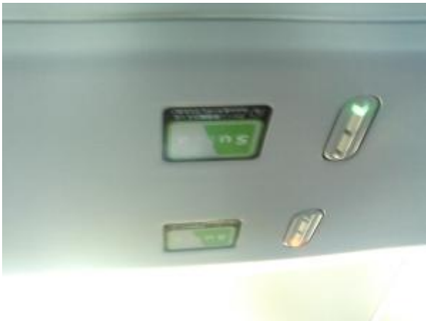
Figuur 15 Groen licht voor gecontroleerde plaats