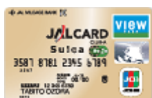
Figuur 13 JALCARD met Suica combinatie

Betaling in winkels levert miles op. Deze miles kunnen worden gebruikt om trein- of vliegreten te betalen.