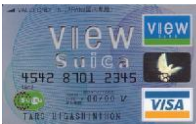
Figuur 12 Credit card met Suica

In juli 2003 lanceerde JR East de Suica View Card, een combinatie van View Card, de credit card van JR East, met Suica (Figuur 12).