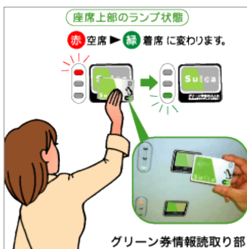
Figuur 14 Treinplaats reserveren met Suica

Door op het station bij speciale machines een eerste klas kaartje te kopen met een Suica kaart, wordt een normaal kaartje overbodig. De informatie over treinnummer, tijd en zitplaats wordt opgeslagen in de Suica kaart. Door deze over een sensor in de trein te halen, identificeert de reiziger zich en verandert het controlelampje van rood naar groen (Figuur 14).